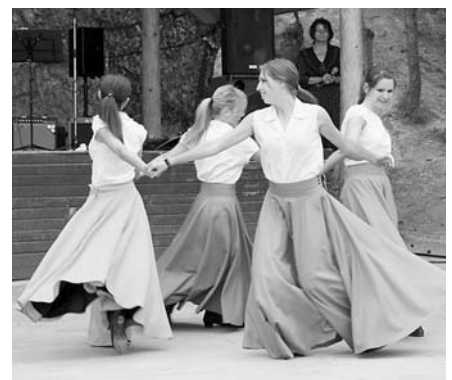
Tanečná skupina Kentucky z Popradu (hore).

kračoval vo výbornej atmosfére svojimi hitmi, ktoré si spolu s ním spievali i mnohí diváci. Spostením programu bolo vystúpenie tanečnej skupiny Kentucky z Popradu, ktorá predviedla svoje úspešné choreografie a záver festivalu patrilo milému hosťovi – veľmi úspeš-