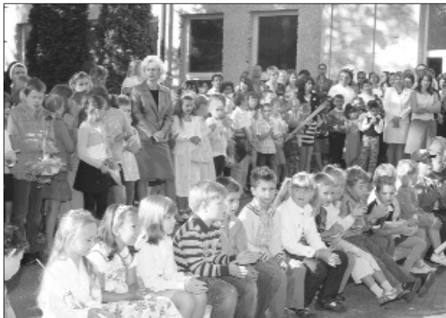
Slávnostné otvorenie nového školského roku v základnej škole na Ul. Komenského vo Svite.