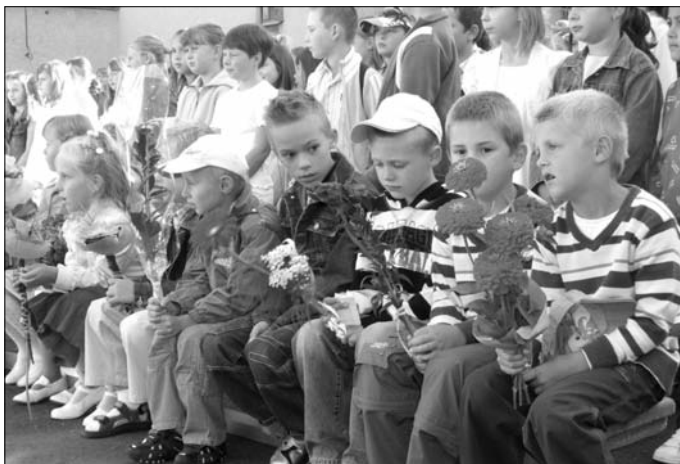
Začiatok školského roku v ZŠ na Ul. mierovej - noví prváčikovia.

Okresné kolo sa uskutoční 27.septembra 2009 o 15.00 hod. v Kinoreštaurácii Spolcentra vo Svite.