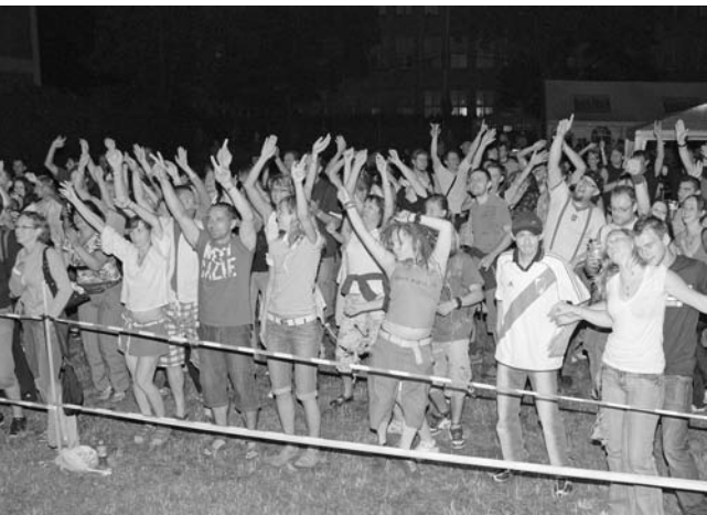
Atmosféra na koncerte