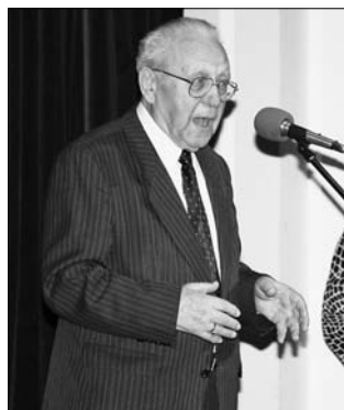
Na slávnostnom odovzdávaní cien v júni 2009.

nosti a zodpovednosť celého riešiteľského kolektívu. Tento a realizačný tím boli tvorené širokou škálou profesií a inštitúcií. Úspešné realizácie doma i v zahraničí umožnili dobrú prezentáciu Svitu – svitských organizácií