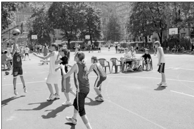
Streetbal sa stretol s ohlasom hráčov...