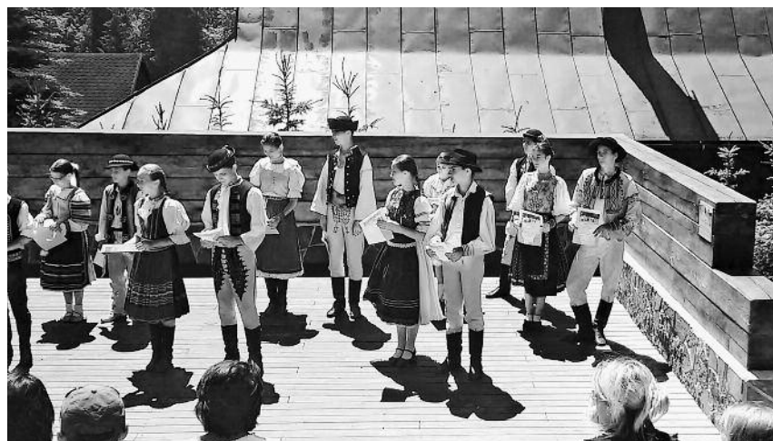
Súbor Jánošíček pri vystúpení v amfiteátri obce Ždiar.