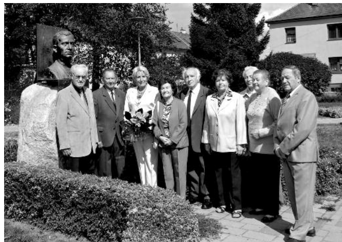
Pri buste J. A. Baťu vo Svite.

Krátko nato sa pri Kolibe uskutočnilo stretnutie seniorov mesta s členmi Slovenského zväzu protifašistických