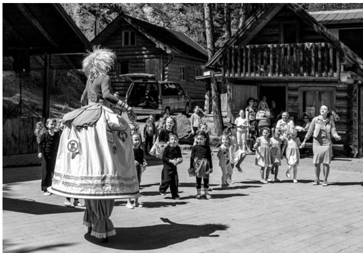
Vydarený Deň detí - viac na str. 7.

hľadnení občania mesta Svit zvýhodneným vstupným. Cena 3,50 eur je podľa neho pre návštevníkov z iných miest nízka, obzvlášť, ak konštatujeme finančnú stratu tohto zariadenia. Riaditeľka Bytového podniku Svit, s. r. o. odpovedala, že školy a niektoré organizácie zľavnené ceny majú a pri tvorbe cenníka vychádzali aj z prieskumu v porovnateľných mestách.