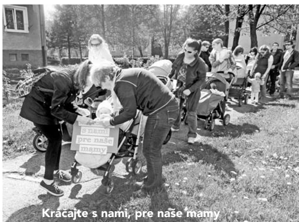
Kračajte s nami, pre naše mamy