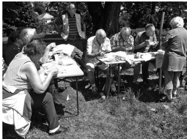
Pekné počasie, dobrý guláš a ľudia so spoločnými záujmami - recept na pekné poobedie.