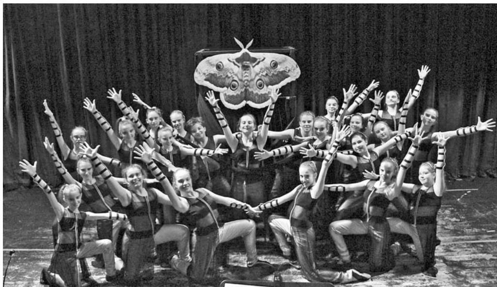
Choreografia Nočná mora , vďaka ktorej dievčatá postúpili na Majstrovstvá Európy.

Ďalšou veľmi úspešnou súťažou bola košícká PRE-DETA : choreografia Gombičkovo – 1. miesto, choreografia Letecký sen – 2. miesto, choreografia Sladké čarovanie – 3. miesto, choreografia 60. roky – 3. miesto, a napokon choreografia Nočná mora , ktorá nedostala len nádherné 1. miesto, ale