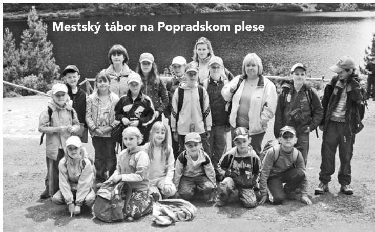
Mestský tábor na Popradskom plese