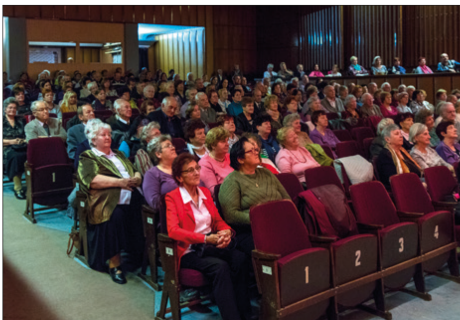
Sála Domu kultúry bola plná