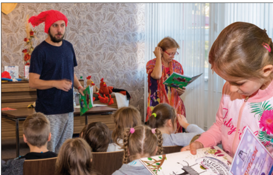
Osmijanko a jeho rozprávky