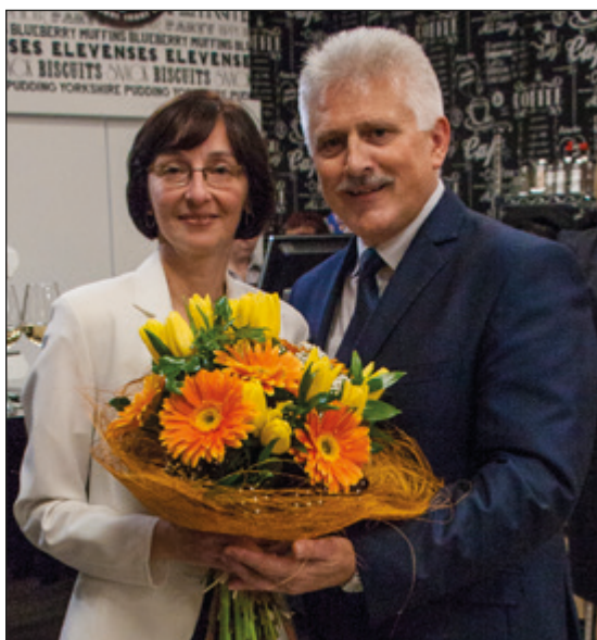
Medzi gratulantmi bol aj primátor mesta...

Vo štvrtok 12. októbra bol pripravený program pre žiakov mladšieho školského veku obidvoch základných škôl v meste,