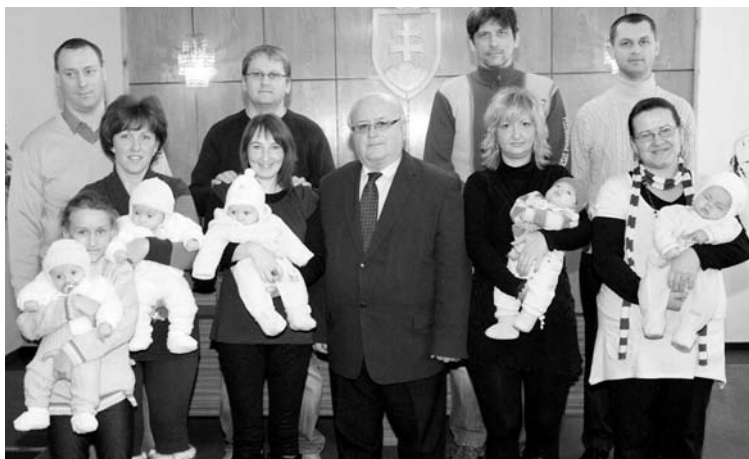
Slávnostné uvítanie detí 4. januára 2012.

ObO ÚŽS Poprad so sídlom vo Svite Podtatranské osvetové stredisko Poprad a Mesto Svit organizujú 45. ročník