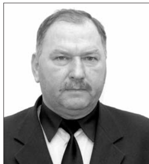
■ Sú medzi vami i príslušníci, ktorí vytrvali od začiatku

riešením veľkého počtu trestných činov a priestupkov. Po vytvorení samospráv a možnosti založiť si vlastný poriadkový útvar pôsobiaci na území mesta, ktorý by zabezpečoval mestské veci verejného poriadku, ochranu životného prostredia