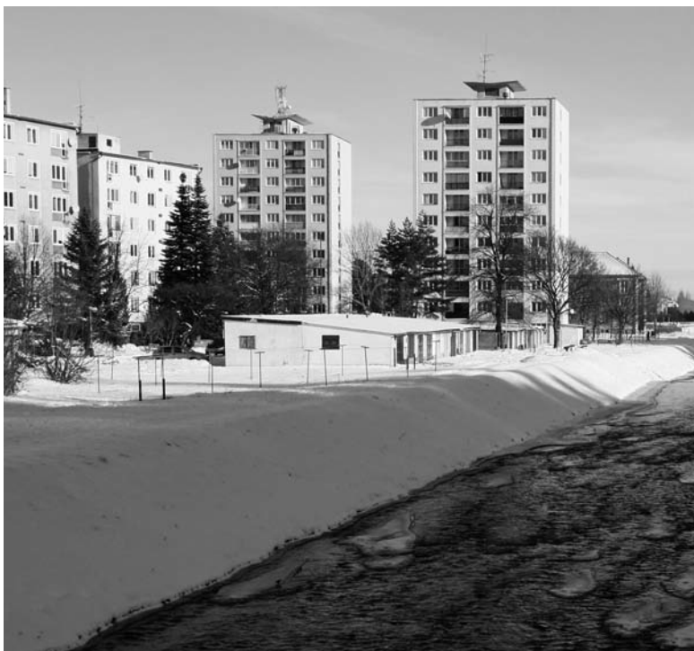
Pohľad na časť Svitu smerom od rieky Poprad.