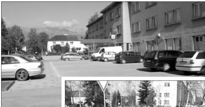
Upravené boli viaceré plochy v meste. Či už parkovisko pred zdravotným strediskom - obr. hore, alebo parkové úpravy za Domom kultúry, alebo pred poštou - obr. vpravo.