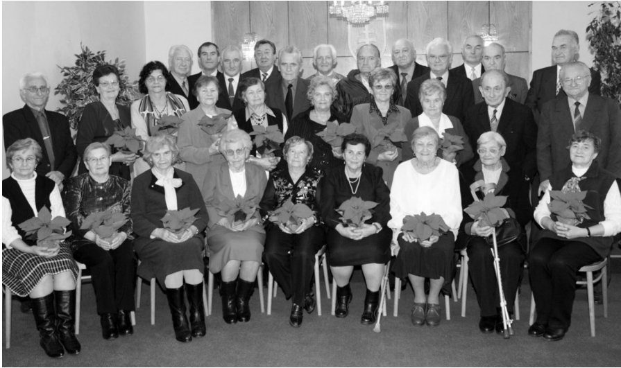
Pohľad na jubilantov, ktorí sa v štvrtom štvrtroku 2008 dožili 70 a viac rokov.