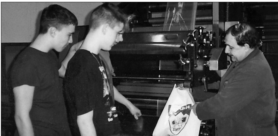
So žiakmi SOUCH, ktorým odovzdával svoje vedomosti i skúsenosti tlačiarja.