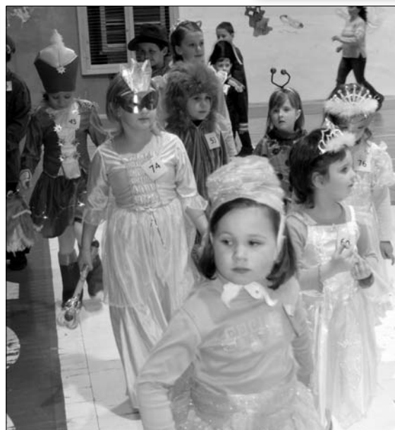
Plesová sezóna je i vo Svite v plnom prúde! Náš obrázok je z detského karnevalu. Viac na str. 3.

na, bytová a verejného poriadku pri MsZ predložila návrh na poskytnutie finančných prostriedkov 11-tim žiadateľom , tieto dotácie schvaľuje na návrh komisie primátor mesta, nakoľko je to v jeho kompetencii. Rokovanie pokračovalo schválením žiadosti BKM Svit o dotáciu na činnosť pre rok 2009 v celkovej výške 19 252 € (579 985, 75 Sk) s termínom vyplatenia 5795, -€ do 15. 2. 2009 a zvyšku dotácie do 30. 4. 2009. Prítomní poslanci schválili aj