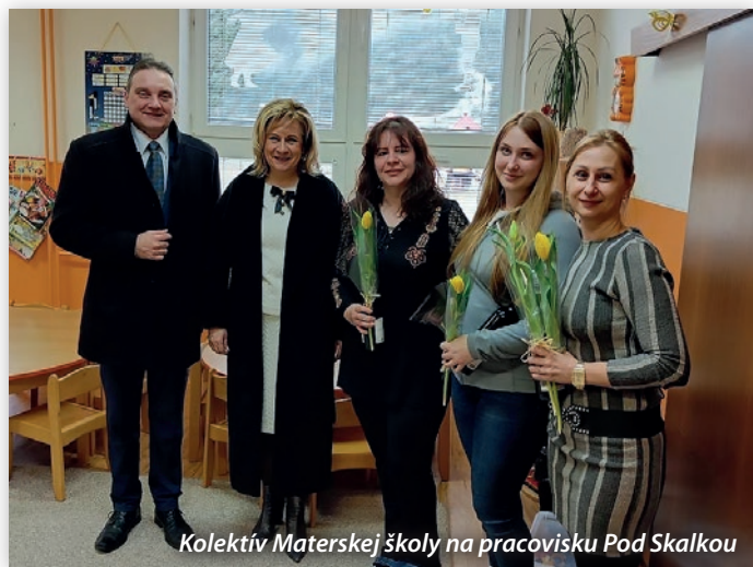
Kolektív Materskej školy na pracovisku Pod Skalkou

Návštevu začala primátorka slovami uznania: „Ste jedno z mála povolání, ktoré má svoj deň a ja si myslím, že to nie je nič zvláštne, že ho máte práve vy. Pretože vy ste tí, ktorí formujete mladých ľudí, vychovávate ich, odovzdávate im svoje vedomosti, skúsenosti a mnohokrát ste to práve vy, ktorí viete o tých deťoch viac ako rodičia. Sedíte pri nich, počúvate ich a pomáhate im. Vy ste boli tí, ktorí sa veľmi rýchlo zorganizovali aj počas pandémie a častokrát ste v provizórnych podmienkach zastrešili vzdelávanie a vyplnili čas deťom, ktoré boli doma. Boli ste nápomocní aj rodičom a našej spoločnosti. Práve preto by som sa vám v mene zriaďovateľa ako aj v mene vedenia mestského úradu chcela poďakovať za to, že sa na vás môžeme spoľahnúť a ja si dovoľím osobne vám popriať v prvom rade veľa zdravia a veľa tvorivých síl. Vaša práca je vaše povolanie, do ktorého sa musíte celým srdcom odovzdať. Chcela by som sa vám poďakovať aj za to, že šírite dobré meno vašej - našej školy nielen na Slovensku, ale aj v zahraničí. Prajem vám do ďalších životných, ale aj pracovných chvíľ všetko dobré.“ Všetkým učiteľom primátorka odovzdala na znak vďaky i malú pozornosť.