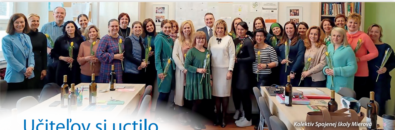
Kolektív Spojenej školy Mierová