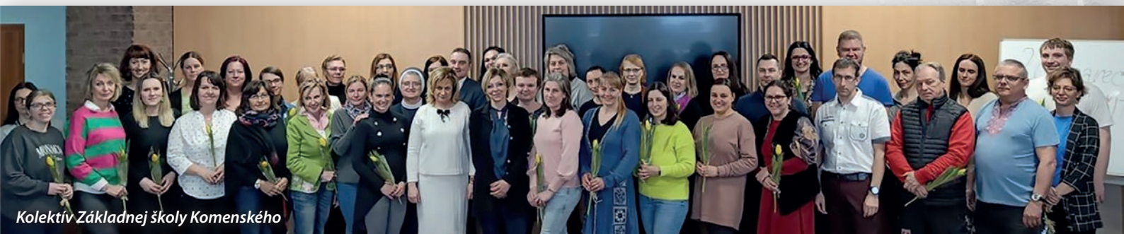
Kolektív Základnej školy Komenského

Daniela Virostko