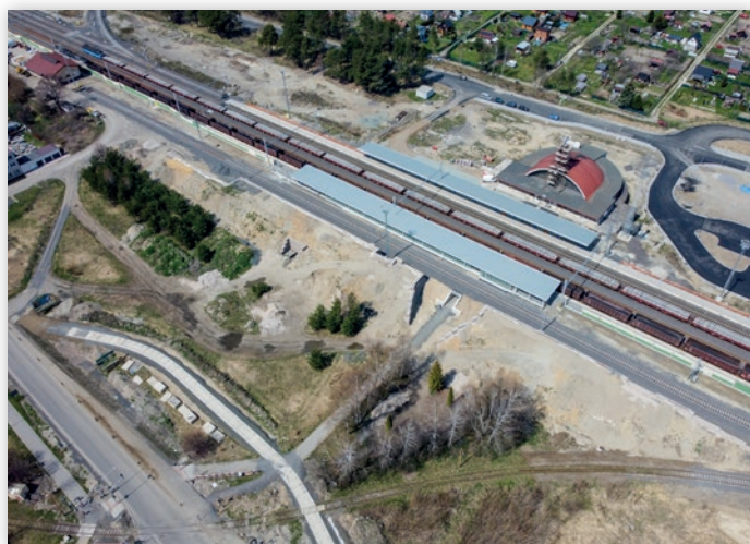
Pohľad na stanicu v polovici apríla 2023