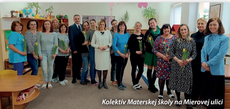
Kolektív Materskej školy na Mierovej ulici

Svetový deň učiteľov sa vo svete oslavuje 5. októbra od roku 1994, kedy ho vyhlásila organizácia UNESCO. U nás i v Česku si ho však pripomíname 28. marca a to od roku 1955, kedy o tom rozhodla vtedajšia Československá vláda, s cieľom morálne oceniť prácu pedagógov. Tento deň nie je náhodný. Je to deň narodenia Jana Amosa Komenského (*28. 3. 1632, †15. 11. 1670), ktorého v bývalom Československu považujeme za „učiteľa národov“. Český pedagóg, filozof a spisovateľ so slovenskými koreňmi v mnohom predstihol svoju dobu - presadzoval povinnú školskú dochádzku pre každé dieťa bez ohľadu na jeho intelekt alebo sociálne pomery, vypracoval systém pedagogiky ako vedy a mnohé jeho vyjadrenia ako „opakovanie je matkou múdrosti“, či „škola hrou“, zľudoveli.