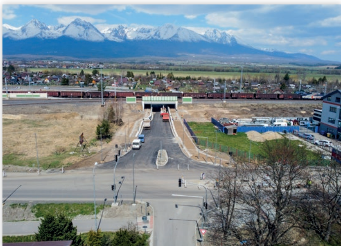
„Podjazd Svit“ cez ktorý budú čoskoro premávať autá

existujúce železničné priecestia. V miestach s obytnou zástavbou, teda v Poprade, Svitě a Lučivnej, budú pozdĺž trate vybudované protiľukové steny. Modernizovaná bude zabezpečovacia a oznamovacia technika, trakčné vedenie a tiež ostatná súvisiaca infraštruktúra, spolu s dotknutými inžinierskymi sieťami. V úseku Poprad - Svit bude vybudované obojsmerné traťové zabezpečovacie zariadenie. Najvýznamnejšou časťou stavby je rekonštrukcia koľajovej časti stanice Svit a preložka trate v mieste zastávky Lučivná. Nástupišťa v stanici a zastávke budú mať výšku 550 mm nad temenom koľajnice a budú s bezkolíznym - mimoúrovňovým prístupom cestujúcich a s úpravou všetkých komunikácií pre chodcov v priestoroch staníc a zastávok