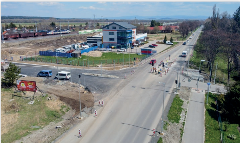
Križovatka 1/18, „Podjazd Svit“ s ulicou Hviezdoslavovou vo výstavbe, apríl 2023

pre osoby s obmedzenou schopnosťou pohybu:“