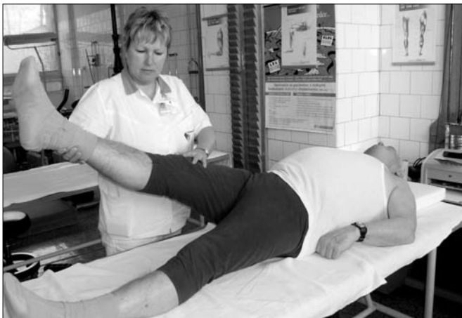
V rehabilitačnom stredisku a. s. Chemosvit.

Dá sa konštatovať, že záujem o nájomné byty je sústavný. Žiadosti na Mestskom úrade pribúdajú a evidujú sa na odbore technických činností a životného prostredia. V tomto čase v celkovom počte 123.