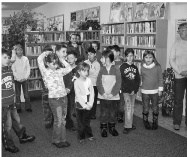
Deti zaujímavá súťaž naozaj zaujala.