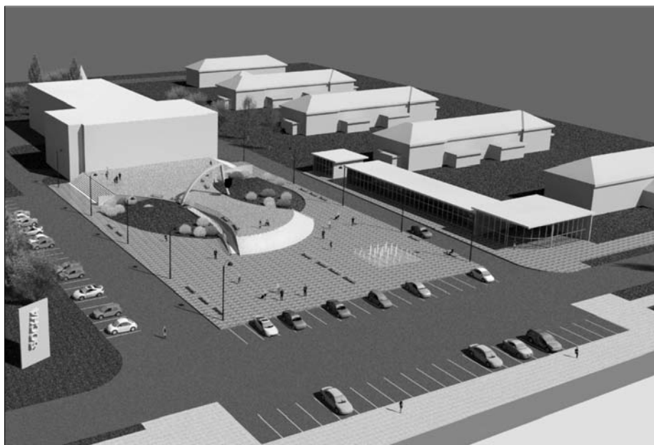
Vizualizácia budúceho námestia pred Domom kultúry vo Svite.

(V prílohe podpisy a pečiatky 30-tich podnikateľov)