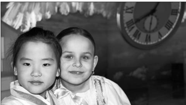
V televíznom štúdiu