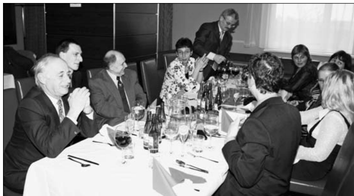
SOŠ mala najviac učiteľov - mužov...