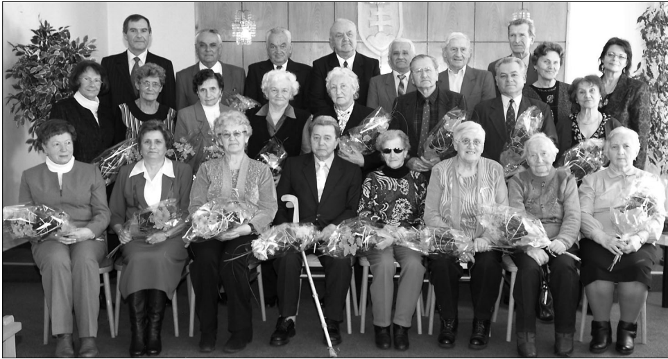
Na tradičné stretnutie s jubilujúcimi občanmi mesta ostáva jubilantom a ich rodinám táto spomienka v podobe spoločnej fotografie.