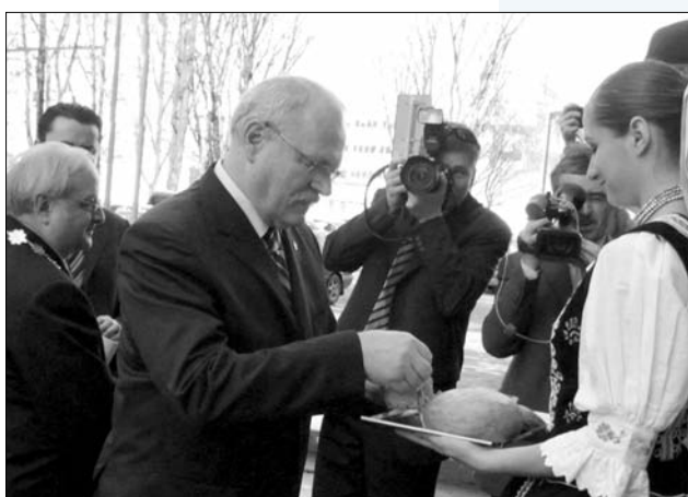
Obrázkom sa vraciame k minuloročnej návšteve Ivana Gašparoviča vo Svite.